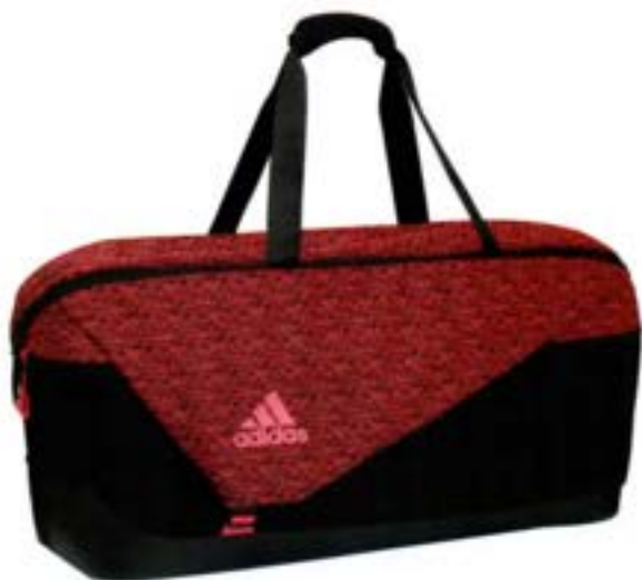
360° 87 Tournament Bag 360° 87 トーナメントバッグ ¥8,490 B0910611 ¥8,490 ¥8,490 ¥8 ショップトップ ¥8,490 ¥8,490 ¥8 71.0L x 38.0H x 21.0W Made in China