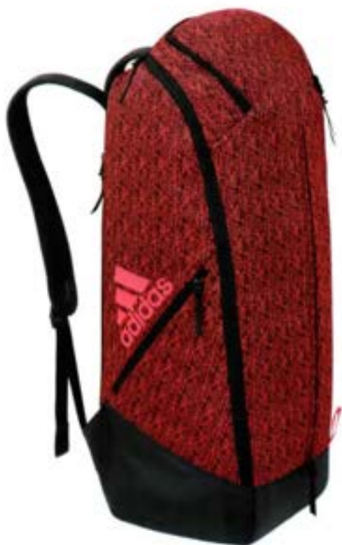
360° 87 Racket Stand Bag 360° 87 ラケットスタンドバッグ ¥8,800 B0910411 ¥8,800 ¥11,000 ¥8 ショップトップ 24.0L x 75.0H x 26.0W Made in China